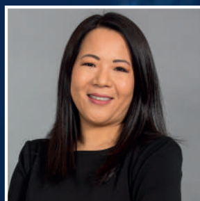
ENORY OKUMA FULLITA

Arbitraje Potestativo (Laboral) / Convenios Colectivos